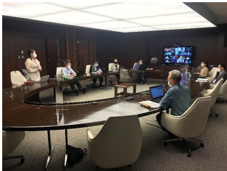
2021年9月14日「第二回サステナビリティ推進委員会」