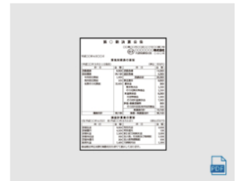
決算 (1) 4段 (13.5cm) × 10.4cm 全国版 : 2,579,200円