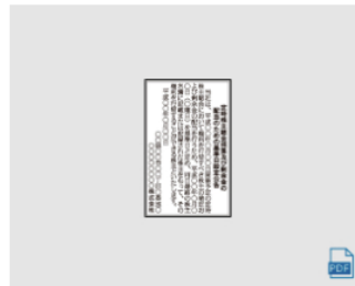
基準日設定 (1) 2段 × 4.2cm 全国版 : 520,800円