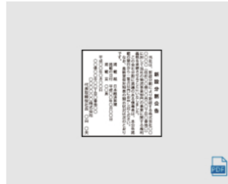
新設分割 2段 × 6cm 全国版 : 744,000円