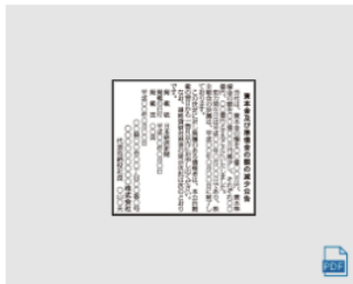
減資 (2) 2段 × 7cm 全国版 : 868,000円