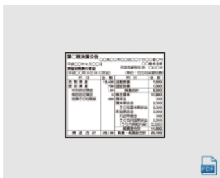
決算 (2) 2段 × 7.8cm 全国版 : 967,200円