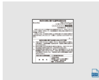
基準日設定 (4) 3段 (10.05cm) 4割 全国版 : 1,710,000円