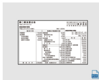
決算 (3) 3段 × 15.8cm 全国版 : 2,938,800円