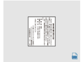
減資 (1) 2段6割 全国版 : 760,000円