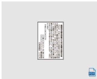
基準日設定 (3) 2段 × 4.6cm 全国版 : 570,400円