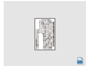
基準日設定 (2) 2段 × 4.3cm 全国版 : 533,200円