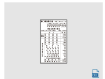
決算 (4) 3段6割 全国版 : 1,140,000円